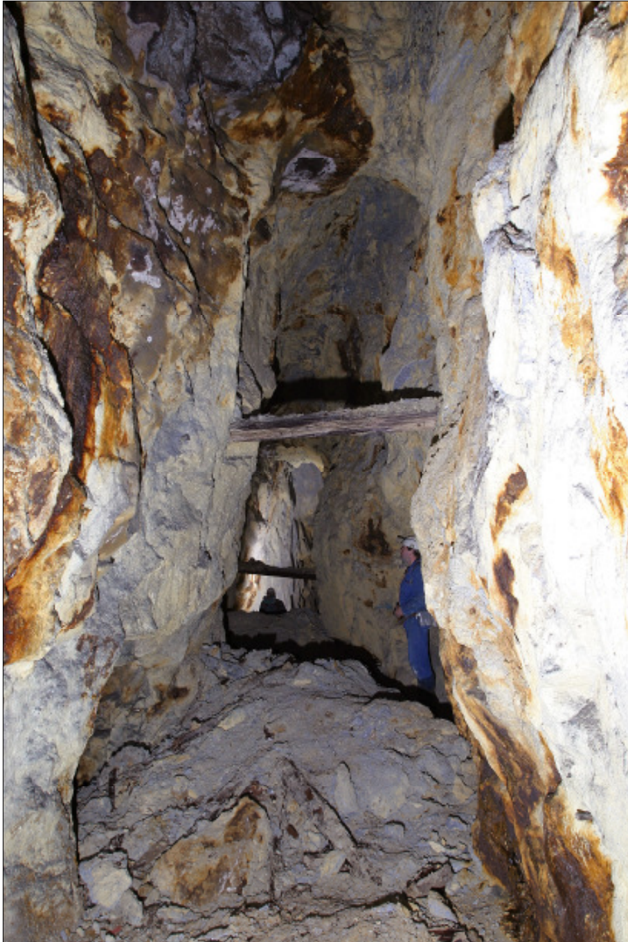
Heilig Kreuzer Gang