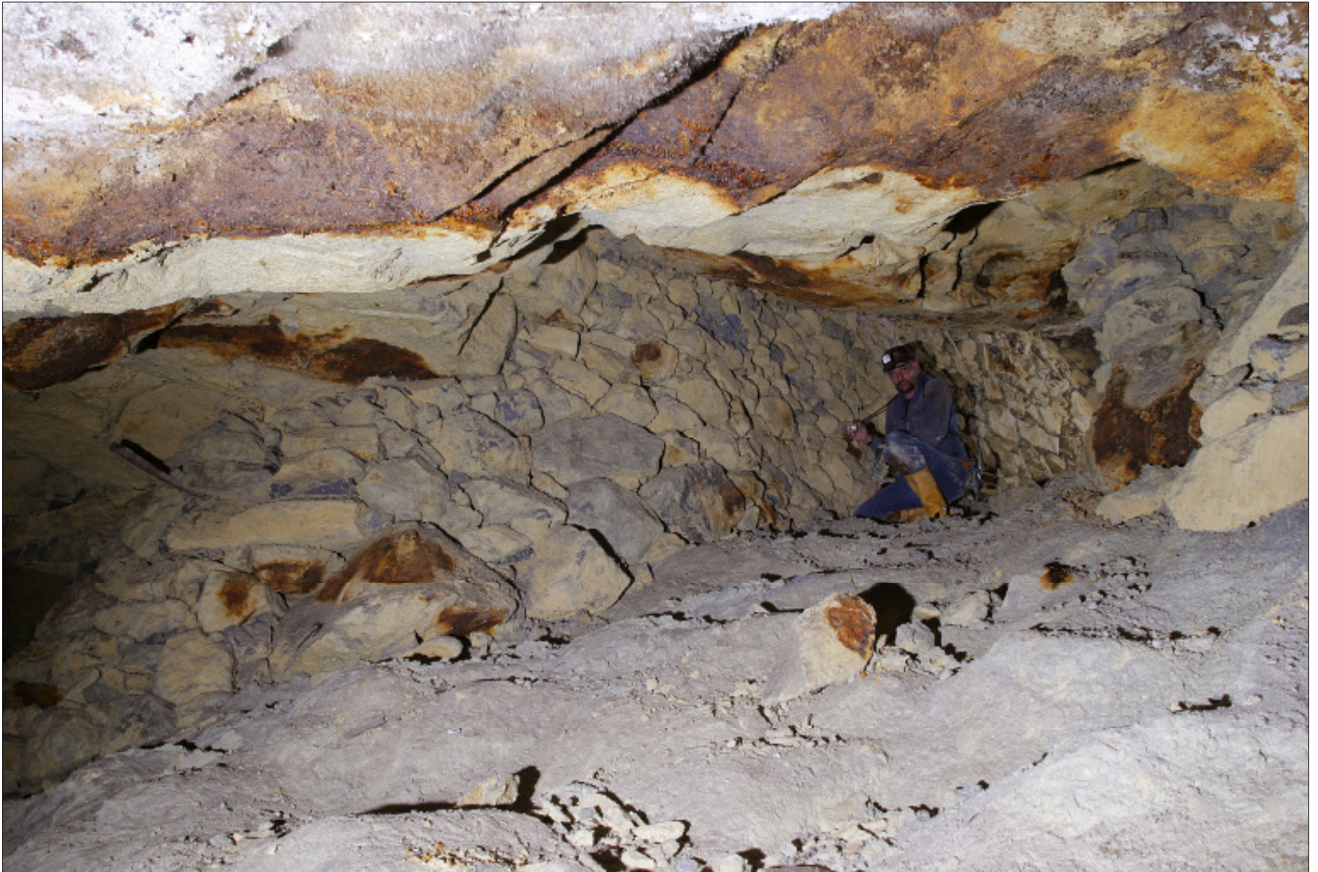
Abbaue aus dem 18.Jh.