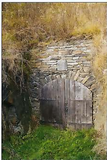
Bild 3: Mundloch des Freudenstein Erbstilln bei Halsbrücke.

Diese Inschrift ist auf Bild 4 dargestellt und bedeutet im Detail: 1765 Den 13. Nov.(ember) I(hre) E(hrwürdige) F(ürstliche) D(urchlaucht) F(riedrich) A(ugust III.) (->der unmündige Kurfürst) I(hre) E(hrwürdige) H(oheit) C(hur-) F(ürstin) M(aria) A(ntonina) (->die Mutter des Kurfürsten) I(hre) E(hrwürdige) H(oheit) P(rinz) X(aver) (->Vormund des Kurfürsten – Bruder des verstorbenen Kurfürsten Friedrich Christian) I(hre) E(hrwürdige) H(oheit) P(rinz) Ca(rl) (->Herzog vom Churland) I(hre) E(hrwürdige) H(oheit) P(rinz) Cl(emens) (-> Bischof von Regensburg und Freisingen) I(hre) F(ürstliche) H(oheit) P(rinzessin) M(aria) E(lisabeth) I(hre) F(ürstliche) H(oheit) P(rinzessin) M(aria) C(unigunde) gefare(n)