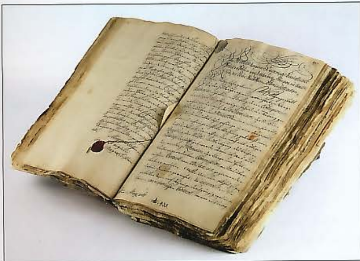
Bild 5: Landesherrliches Reskript zur weiteren Gestaltung der Bergakademie von Prinzregent Xaver an das Oberbergamt Freiberg.

Es ist nicht ganz sicher, wann Heynitz den Antrag zur Gründung der Bergakademie übergeben hat, aber es wird stark vermutet, dass es bei dem Essen im Schloss Freudenstein am 13. November geschah. In Heynitz' „Vortrag an Se. Königlichen Hoheiten“, datiert „Freyberg am 13. November 1765“, wurde eine konkrete Aufstellung der Kosten für die Ausbildungsbereiche aufgeschlüsselt. Der Fonds für die geometrische Zeichenschule sollte 240 Taler, der Fonds für die metallurgische-chemische Schule 160 Taler, der Fonds für Stipendien 500 Taler betragen und der Fonds für eine anzulegende Modellkammer, Stufenkollektion und Bergbüchersammlung belief sich auf 300 Taler, insgesamt also 1.200 Taler