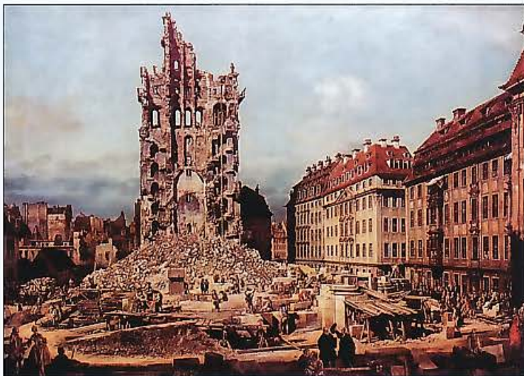
Bild 1: Die Ruine der Kreuzkirche in Dresden nach dem Siebenjährigen Krieg. Gemälde von Bernardo Bellotto, 1765.

Die immer heftiger werdenden politischen Spannungen zwischen Preußen und Sachsen führten dazu, dass am 29.08.1756 die preußische Armee die Grenze zu Sachsen ohne Kriegserklärung überschritt. Damit begann der Siebenjährige Krieg, der für Sachsen eine lange Leidenszeit brachte. Die besetzten Dörfer und Städte wurden systematisch ausgeplündert und durch ein „Feldkriegsdirكتورium“ wurden die sächsischen Früchte aus dem Land gepresst. Von den Städten wurden hohe Kontributionen gefordert: von Leipzig 1760 eine Million, Merseburg 120 000, Chemnitz 21 500, Naumburg 200 000 und Zwickau 80 000 Taler. Insgesamt sollen ca. 48 Millionen Reichstaler an Kontributionen nach Preußen geflossen sein. Hinzu kamen etwa 45 Millionen Reichstaler Gewinne aus den preußischen Münzfälschungen. Viele Sachsen wurden in die preußische Armee zwangsrekrutiert. 1760 wurde Dresden durch den preußischen Kanonenbeschuss zur Hälfte zerstört und besonders die Brühl'schen Schlösser ließ der Preußenkönig