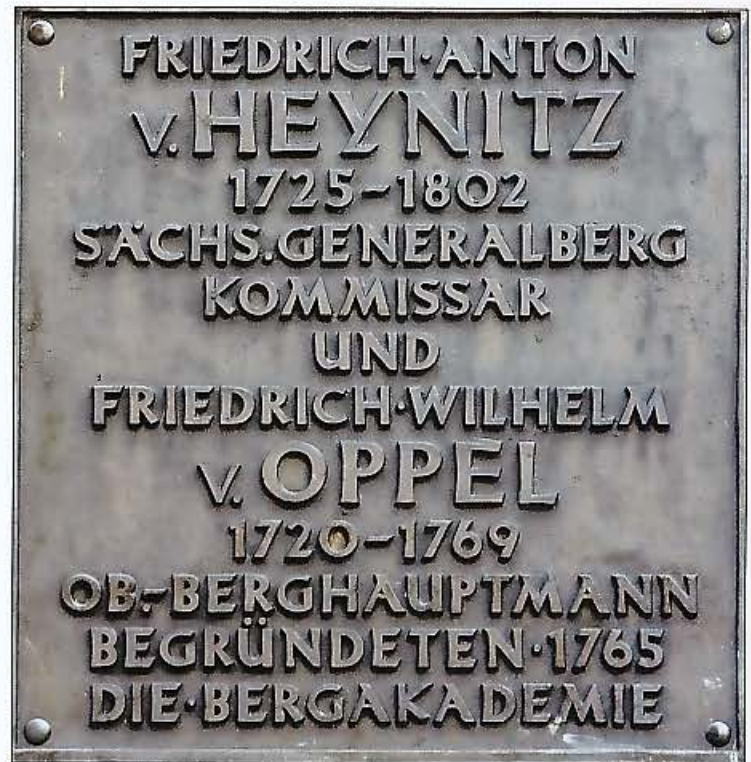
Bild 9: Tafel am Hauptgebäude der TU Bergakademie Freiberg für die Gründer Friedrich Anton von Heynitz und Friedrich Wilhelm von Opper.

Mit der Gründung der Bergakademie zur Ausbildung der Bergbeamten und Bergingenieure wurde die notwendige Institution