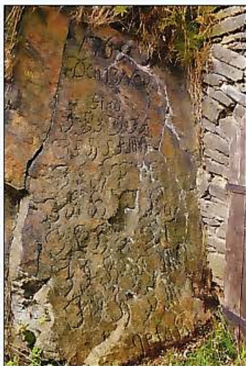
Bild 4: Inschrift vom landesherrlichen Besuch am 13. November 1765 am Mundloch des Freudenstein Erbstilln.