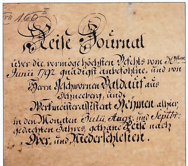
Bild 8: Titelblatt des Reiseberichts von Karl Gottfried Baldauf nach Ober- und Niederschlesien.

Karl Gottfried Baldauf (1751-1811) stammte aus Marienberg und studierte ab 1769 (Matrikel Nr. 54) an der Bergakademie. 1775 wurde er bereits Oberkunststeiger, 1785 Vizeschworener,